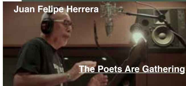
Juan Felipe Herrera