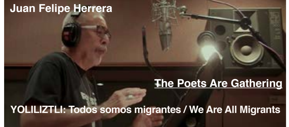
Juan Felipe Herrera